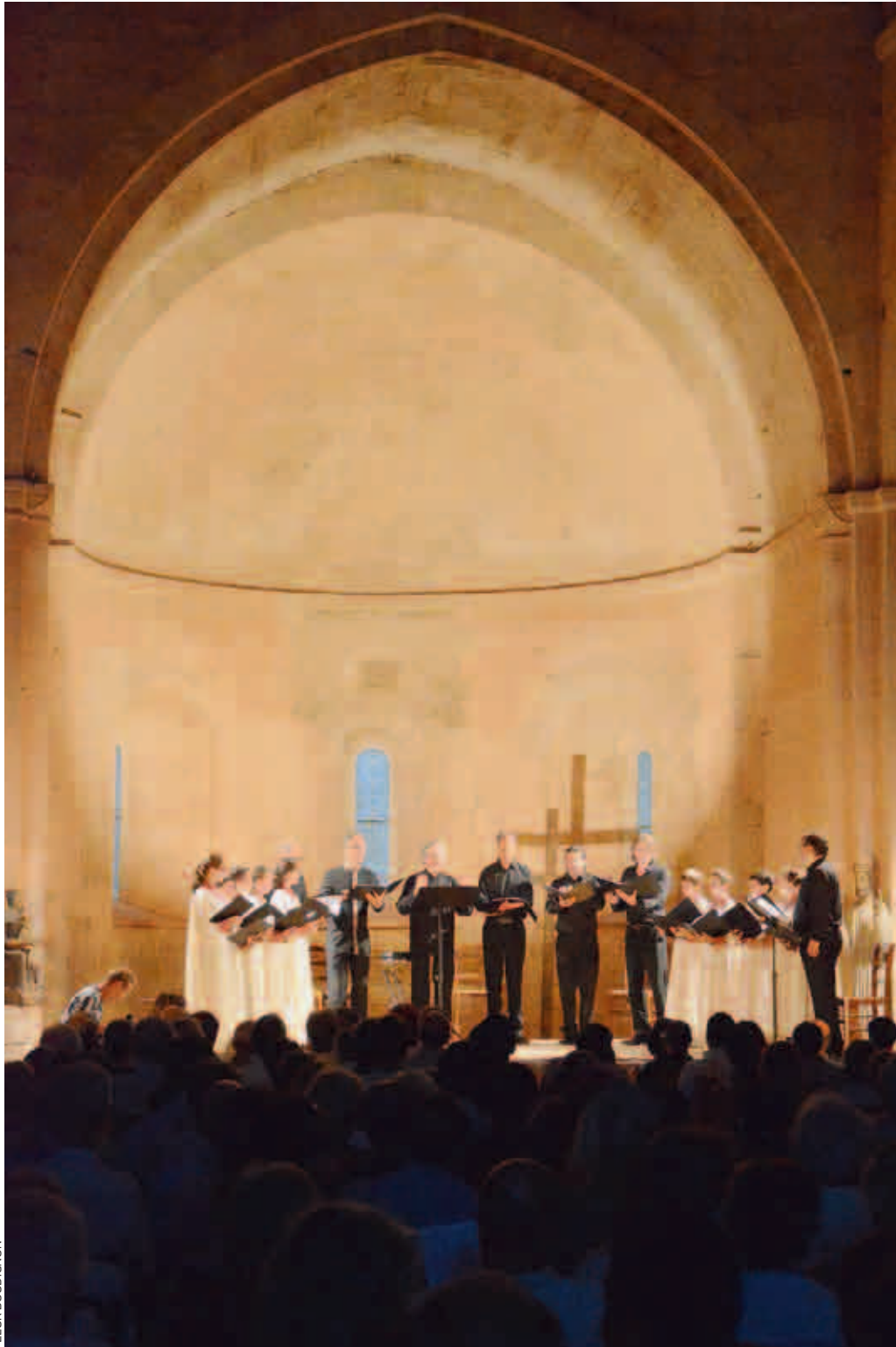
Au programme cette année, l' Office de la Circoncision à la cathédrale du Puy-en-Velay .